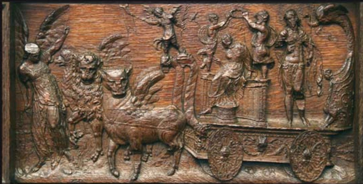
Het Hoogkoor - de zuiderkoorbank (1540/42) - De triomf van Christus - vijfde paneel.

De triomfwagen van Christus, getrokken door de vier symbolen van de evangelisten: Lucas als os, Markus als leeuw, Johannes als adelaar, Mattheus als mens.