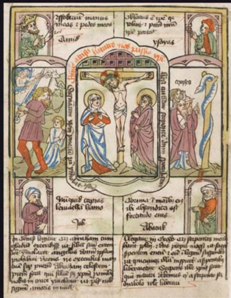
Het offer van Abraham - Genesis 22 vers 1-19