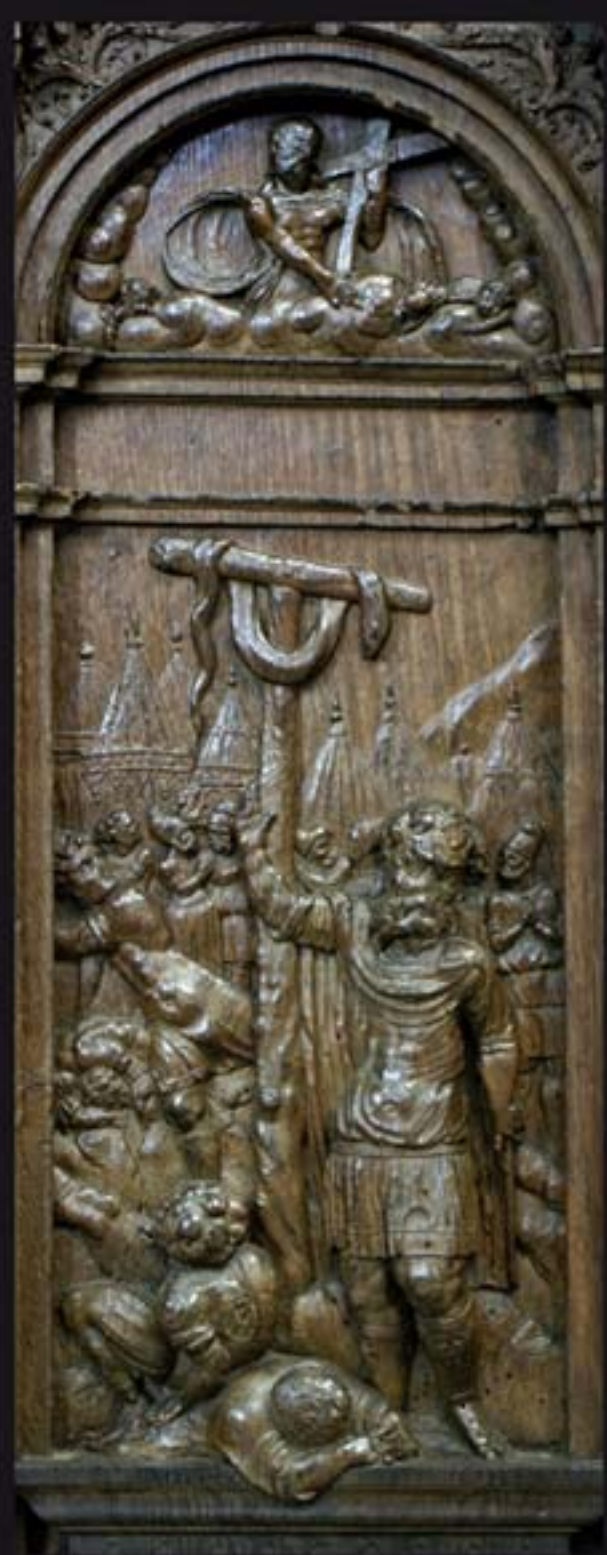
De koperen slang - Numeri 31 vers 4-9