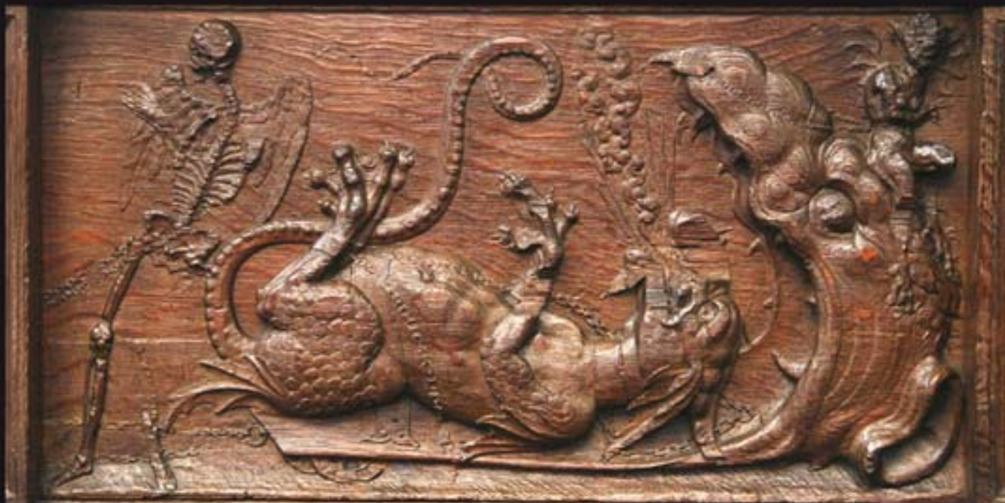
Het Hoogkoor / de zuiderkoorbank (1540/42) - De triomf van Christus - zesde paneel.

Achter de Ecclesia de opgestane Christus.