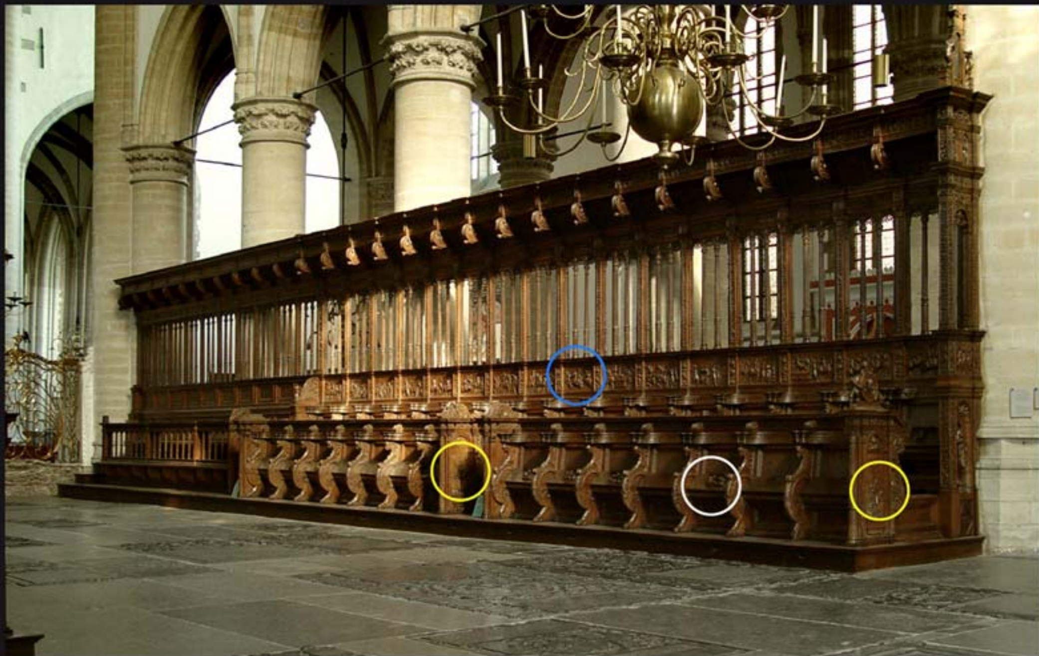
Het Hoogkoor - de noorderkoorbank (1538/39). Tot de reformatie in 1572 kwamen de geestelijken zevenmaal per dag in het koor samen om de zogenaamde getijden te bidden naar psalm 119 : 164: 'Ik loof U zevenmaal des daags, over de rechten Uwer gerechtigheid'. Op de koorbanken zijn bijbelse onderwerpen uitgebeeld op de wangen (gele cirkel), de misericorden (onderzijde opklapbare zittingen - witte cirkel) en de panelen (blauwe cirkel).