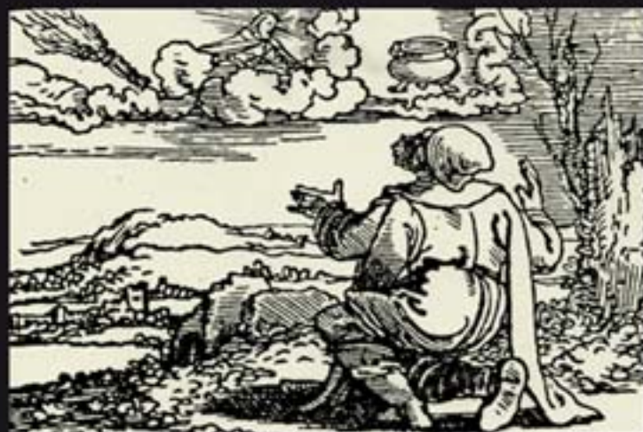
Roeping van Jeremia een waeckende roede - een gloeyenden pot