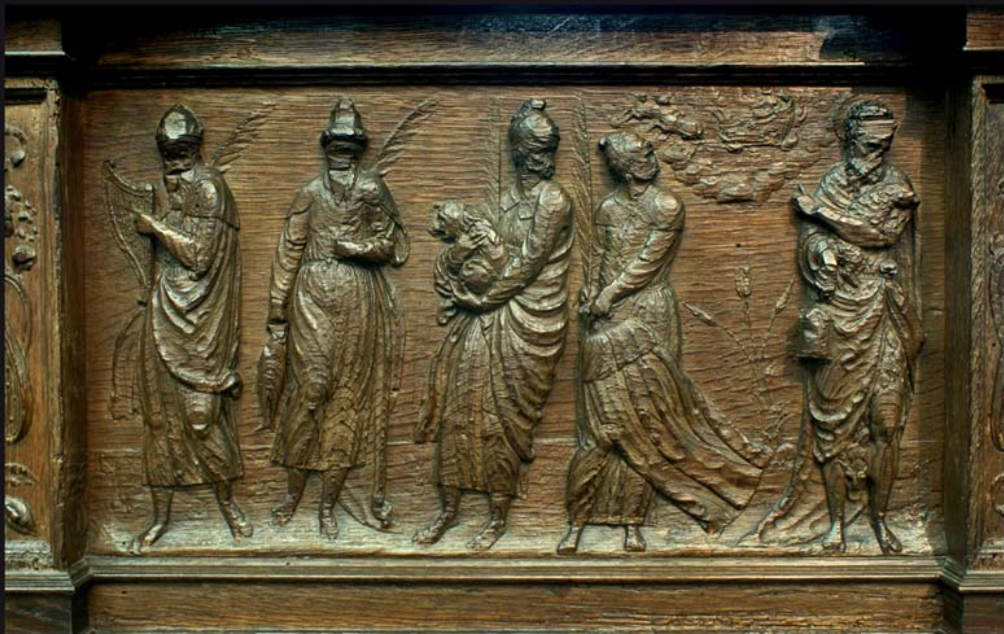
Het Hoogkoor - de zuiderkoorbank (1540/42) - De triomf van Christus - tweede paneel.

David met harp (type van Christus) - Jona met vis (type van Christus: drie dagen in het graf) - Simson met leeuw (type van Christus als overwinnaar van de zonde) - Elisa met mantel Elia en hemelvaart Elia (beeld Christus' hemelvaart) - Johannes de Doper met lam en lamp.