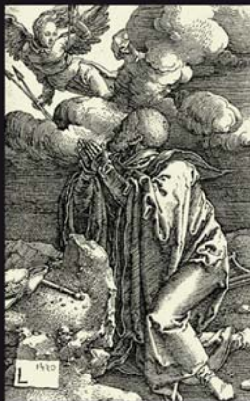
David in gebed na de volkstelling