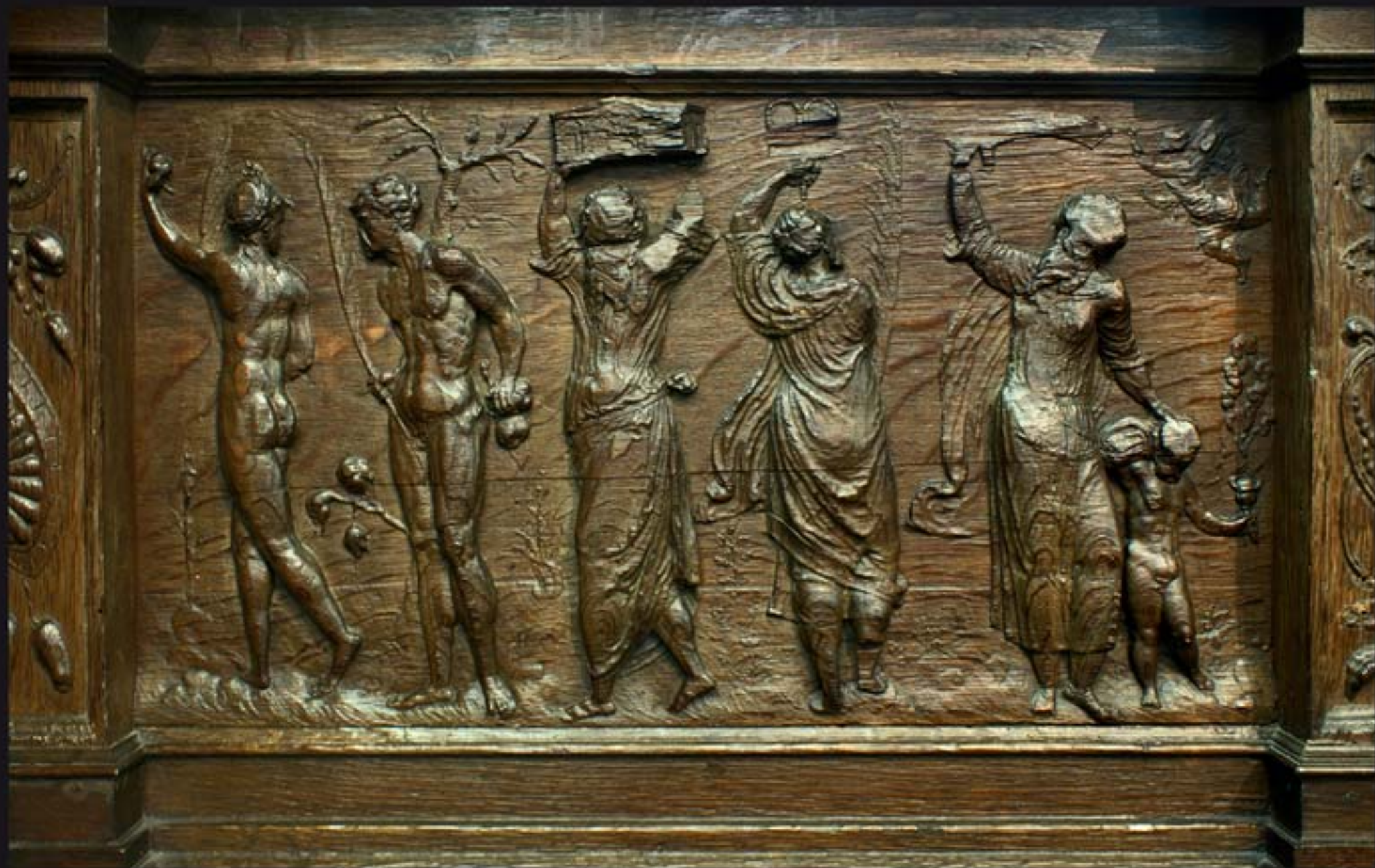
Het Hoogkoor - de zuiderkoorbank (1540/42) - De triomf van Christus - eerste paneel. Eva en Adam (Christus - tweede Adam) - Noach met ark (Christus de Ark des Behouds) - Mozes met wet (Christus de wetsvervuller) - Het offer van Abraham (beeld van de offerdood van Christus).